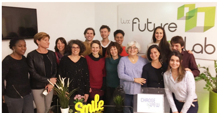
Reunión transnacional pre Covid19 #Changeofview_eu

La mayoría del trabajo que se realizaba en estos proyectos era online desde un inicio, porque los desplazamientos están limitados y definidos desde la planificación inicial a ciertos momentos. Pero obviamente la pandemia ha afectado. Desde marzo de 2020 se han interrumpido estas reuniones transnacionales que se tenían previstas.